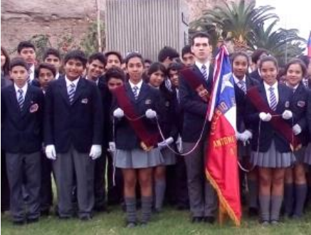
COLEGIO CARDENAL ANTONIO SAMORÉ CON DESEMPEÑO DE EXCELENCIA ACADÉMICA